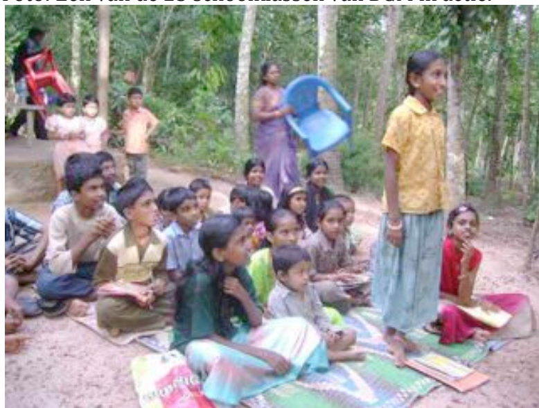
Foto: Een van de 25 schoolklassen van BGM in actie.

Zij helpen ook met het duidelijk maken en het belang van campagnes ten behoeve van het milieu, zoals het weren en afvoeren van niet-composteerbare plastic afval uit het bos. Deze acties worden voorbereid door deze begeleidsters met een introductie over milieu in de Zelf-Hulp-Vrouwengroepen. BGM verzorgt ook regelmatig bewustzijnswordings-campagnes voor moeders op het gebied van gezonde kindervoeding, gezondheid en sanitatie. Dergelijke voorlichtingscampagnes zijn van groot belang voor deze groep. BGM beveelt aan om zakken van bladeren en papier te gebruiken i.p.v. plastic zakken. Kosten zijn: 1.000.